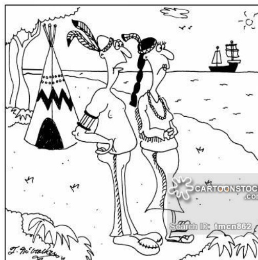
“There goes civilization as we know it.”