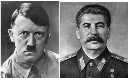
Adolf Hitler – Josef Stalin