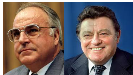
Helmut Kohl – Franz Josef Strauß