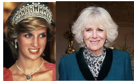
Lady Diana (Diana Frances Spencer) - Camilla Parker Bowles