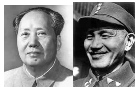
Mao Zedong – Chiang Kai-shek