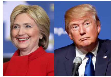
Hillary Clinton - Donald Trump