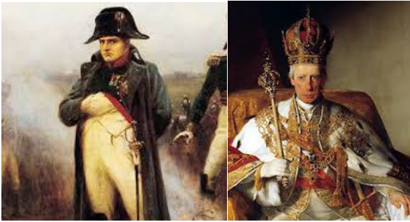
Napoleon Bonaparte - Kaiser Franz I.

Abgebildet sind jeweils zwei Kontrahenten der Geschichte. Schreibt beide vollständigen (üblichen) Namen unter das Bild (0,5 für einen richtigen Namen)!