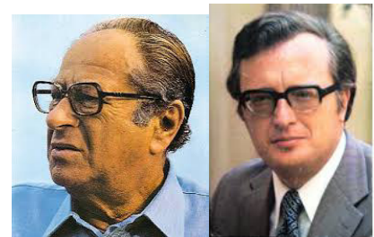
Bruno Kreisky – Josef Taus