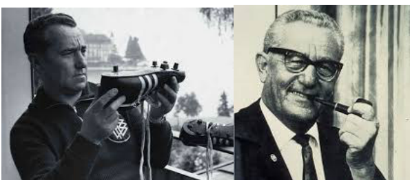
Adolf Dassler – Rudolf Dassler