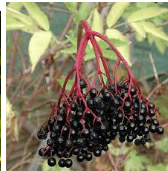
Schwarzer Holunder Holler