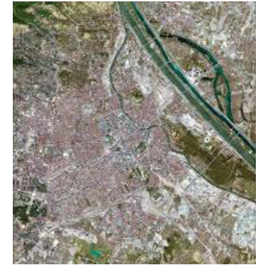
San Francisco + Oakland