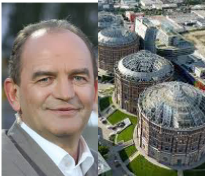
Herbert Prohaska Gasometer Simmering (11.)

Abgebildet sind bekannte Personen, die in einem bestimmten Wiener Gemeindebezirk entweder geboren wurden oder hier eine wichtige Phase ihres Lebens verbracht haben. Nebenbei ist immer ein Bauwerk aus dem jeweiligen Bezirk zu sehen. Gesucht sind die Person, die Sehenswürdigkeit und der richtige Bezirk (1 Punkt für alle drei Antworten, 0,5 Punkte für zwei)!