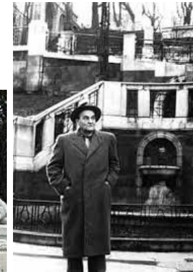
Heimito von Doderer Strudelhofstiege Alsergrund (9.)