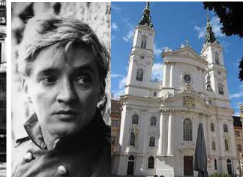
Oskar Werner Piaristenkirche Maria Treu Josefstadt (8.)