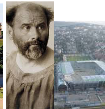
Gustav Klimt Weststadion (Allianz-Stadion) Penzing (14.)