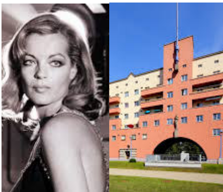
Romy Schneider Karl-Marx-Hof Döbling (19.)