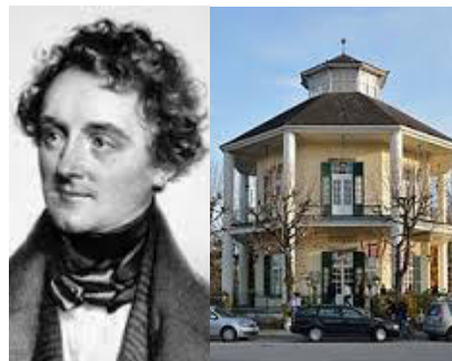
Johann Nestroy Lusthaus Leopoldstadt (2.)