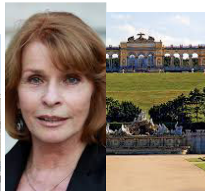
Senta Berger Gloriette Hietzing (13.)