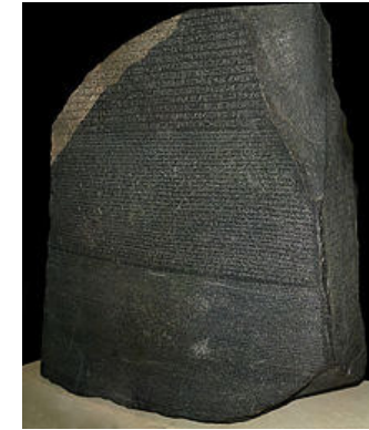
Stein von Rosette