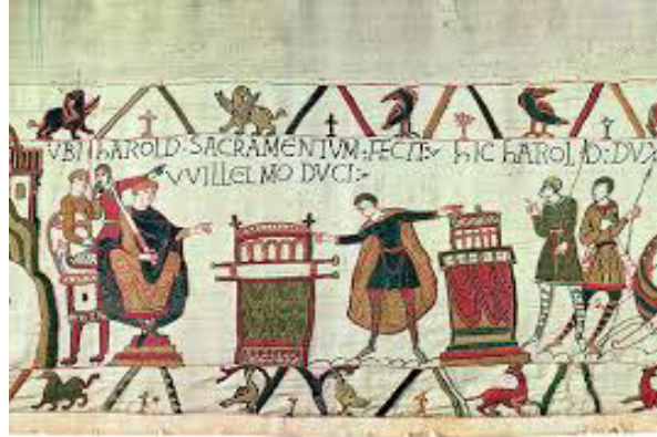
Teppich von Bayeux