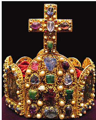
Kaiserkrone Hl. Röm. Reich