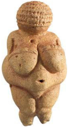
Venus von Willendorf

Auf den Bildern sind Artefakte der Menschheitsgeschichte abgebildet. Benenne sie exakt!