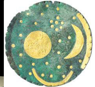
Himmelscheibe von Nebra