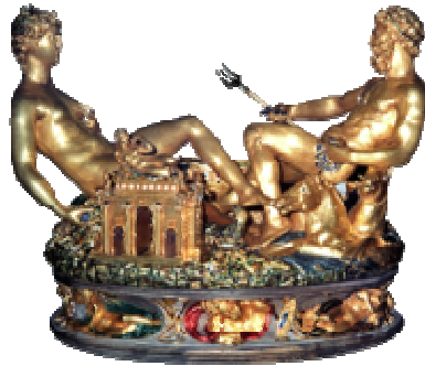
Saliera (von Benvenuto Cellini)