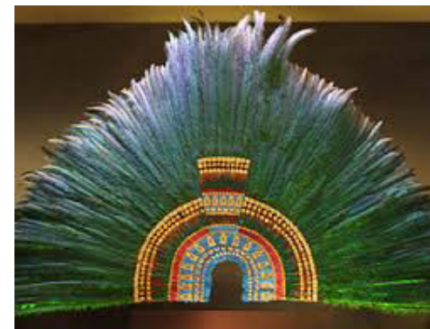
Federkrone Montezumas (Moctezumas)