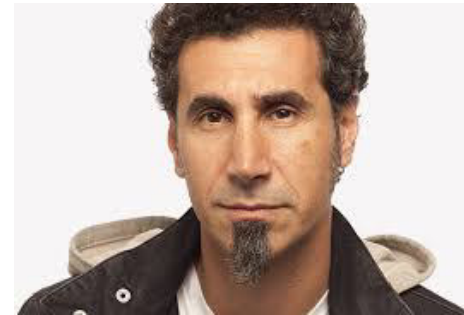
Serj Tankian SYSTEM OF A DOWN