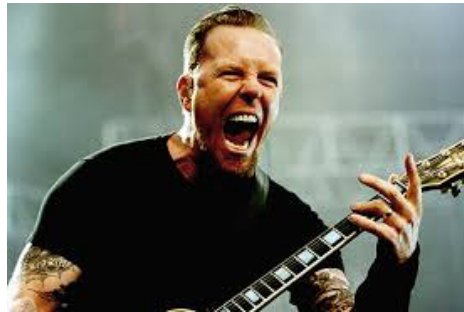
James Hetfield METALLICA