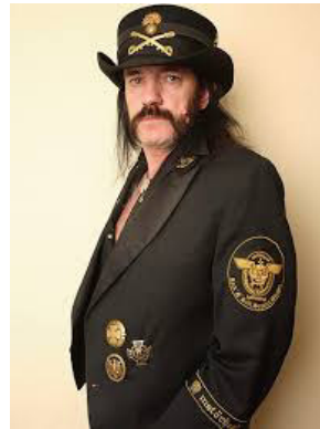
Ian „Lemmy“ Kilmister MÖTORHEAD