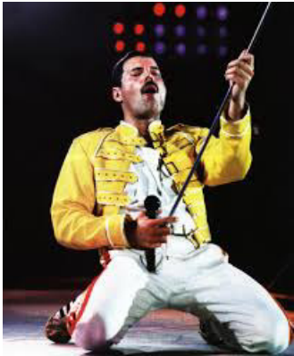
Freddy Mercury QUEEN

Abgebildet sind Sänger von Rockbands diverser Richtungen. Benennt die Personen richtig (ein halber Punkt) und schreibt die bzw. eine Band dazu, bei der die abgebildete Person Leadsänger ist oder war (ein halber Punkt).