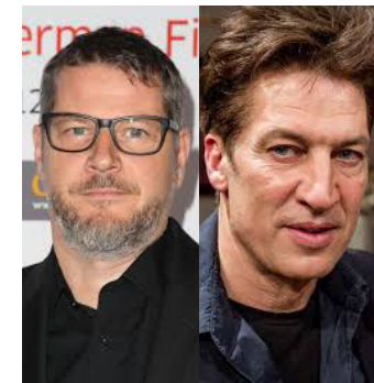
Andreas Prochaska/Tobias Moretti

Ludwig II., Gewalt und Leidenschaft, Die Verdammten Hexen von heute