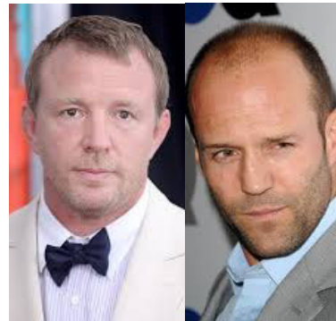
Guy Ritchie/Jason Statham

Aguirre, Nosferatu, Fitzcarraldo, Cobra Verde Woyzeck, Mein liebster Feind