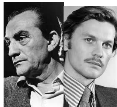
Luchino Visconti/Helmut Berger

Ludwig II., Gewalt und Leidenschaft, Die Verdammten Hexen von heute