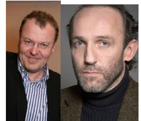
Stefan Ruzowitzky/Karl Markovics

Alles über meine Mutter, Volver, Live Flesh