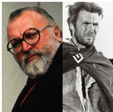
Sergio Leone/Clint Eastwood

Für eine Handvoll Dollars, Für ein paar Dollar mehr, Zwei glorreiche Halunken