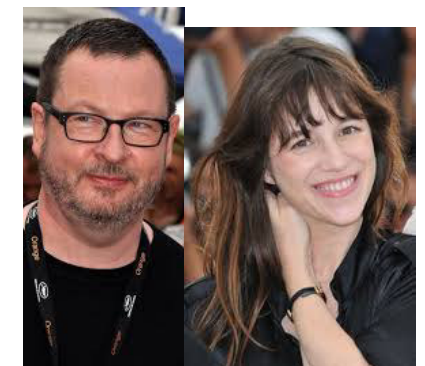
Lars von Trier/Charlotte Gainsbourg