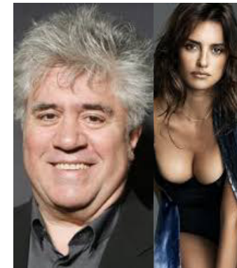
Pedro Almodovar/Penelope Cruz

Alles über meine Mutter, Volver, Live Flesh