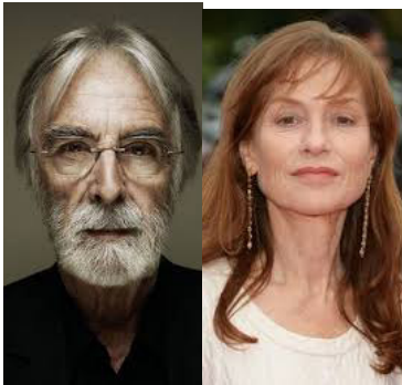
Michael Haneke/Isabelle Huppert

Abgebildet sind jeweils ein europäischer Regisseur und eine Schauspielerin bzw. Schauspieler. Benennt die beiden Personen richtig (Vor- und Nachname) und schreibt genau einen Film dazu, an dem beide Personen beteiligt waren. Einen halben Punkt gibt es für die beiden Namen, einen halben für den Film.