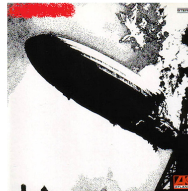
Led Zeppelin I (1969)