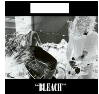
Nirvana – Bleach (1989)