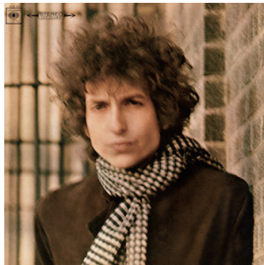
Bob Dylan – Blonde on Blonde (1966)