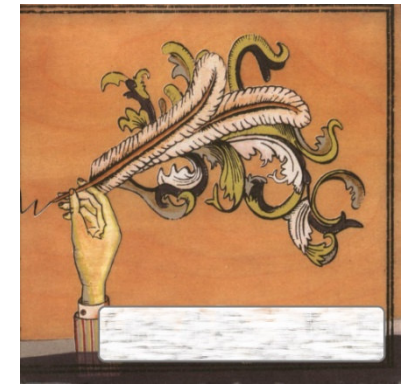
Arcade Fire – Funeral (2004)