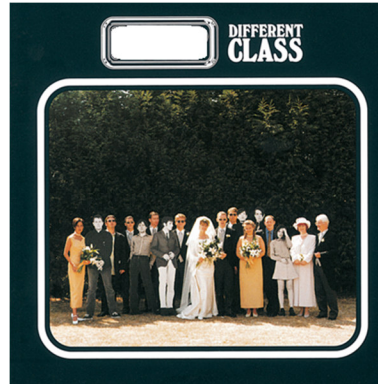
Pulp – Different Class (1995)