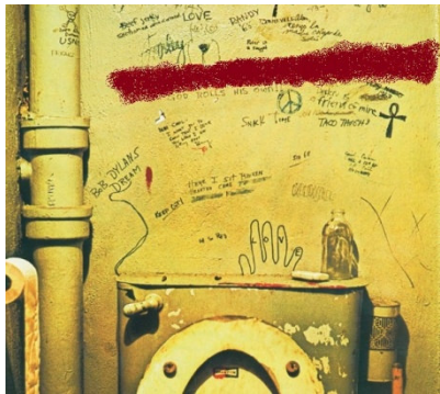
Rolling Stones – Beggars Banquet (1968)

Folgend findet ihr 10 Album-Covers von durchwegs bedeutenden Alben der älteren und jüngeren Musikgeschichte. Teilweise ist der Albumtitel ersichtlich, die Interpreten haben wir euch jedenfalls absichtlich vorenthalten... Wir suchen jeweils den bzw. die Interpreten!