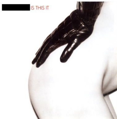
The Strokes – Is This It (2001) – internat. Cover (außerhalb U.S.)