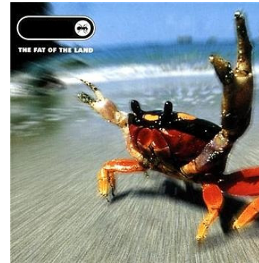
The Prodigy – The Fat Of The Land (1997)