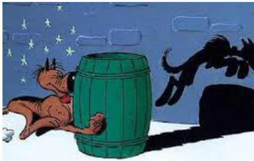
Rantanplan Lucky Luke Morris (Maurice de Bevere)

Zu sehen sind Comic- und Trickfilmfiguren. Benennet jeweils die abgebildete Figur und den Titel des „Comics“ richtig (0,5 Punkte) und schreibt auch den Zeichner bzw. Schöpfer dieser Figuren hin (auch 0,5 Punkte).