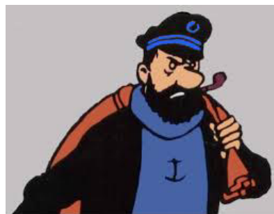
Kapitän Haddock Tim und Struppi Herge (Georges Prosper Remi)