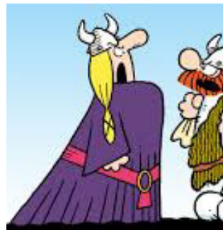
Helga Hägar der Schreckliche Dik Browne