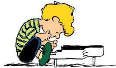
Schroeder The Peanuts Charles M. Schulz