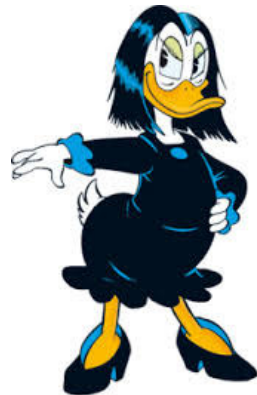
Gundel Gaukeley Dagobert Duck, LTB,... Carl Barks (Walt Disney)