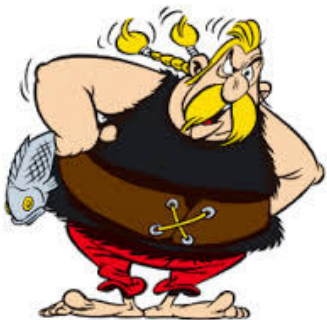
Verleihnix Asterix (und Obelix) Albert Uderzo