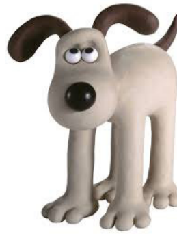
Gromit Wallace & Gromit Nick Park