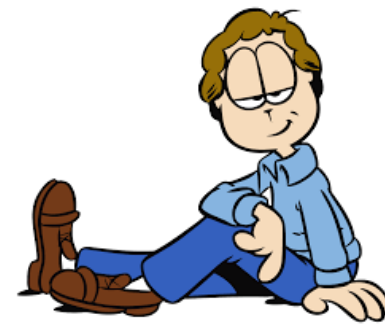
Jonathan Q. „Jon“ Arbuckle Garfield Jim Davis