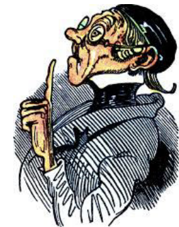
Lehrer Lämpel Max und Moritz Wilhelm Busch