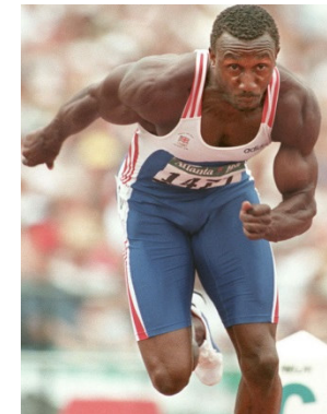
10. Linford Christie