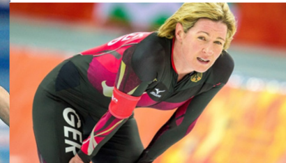
9. Claudia Pechstein